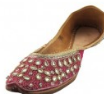
Handcrafted Beaded & Seq...